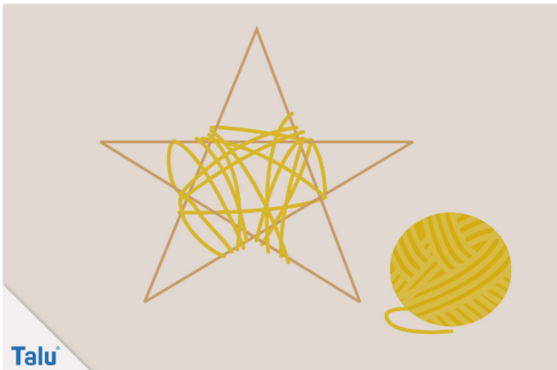
Stern aus Holzstäben und Wolle

Tipp: Wickeln Sie ruhig kreuz und quer. Wichtig ist, dass zum Schluss alle Bereiche möglichst gleichmäßig umwickelt sind – und dass der Stern am Ende schön „buschig“ beziehungsweise weich aussieht.